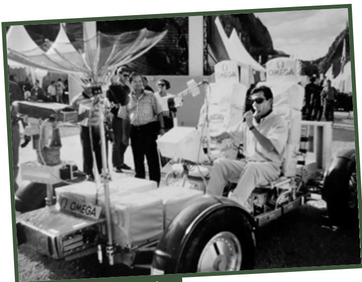
■ Moment fort lors de quelques mètres au volant du Lunar Roving Vehicle.

France, l'Europa truck Trial... C'est devenu ma passion et j'aime le speed comme faire une interview tous les quarts d'heure à Valloire même stressé, je reste perfectionniste tout en conservant une bonne dose de spontanéité.