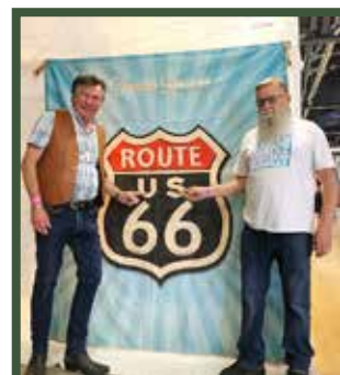
■ Quelques infidélités au monde du 4x4.

un brin de tout-chemin avec et j'ai bien l'intention de le garder. Et puis, je viens d'acheter un VTC électrique pour aller acheter le pain.