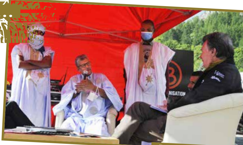
■ Entretien avec le responsable du tourisme mauritanien.

un brin de tout-chemin avec et j'ai bien l'intention de le garder. Et puis, je viens d'acheter un VTC électrique pour aller acheter le pain.