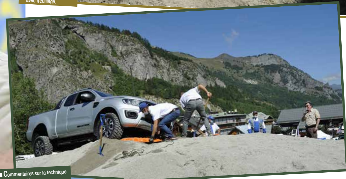
■ Commentaires sur la technique du désensablage.