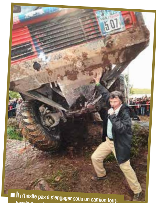
■ Il n'hésite pas à s'engager sous un camion tout-terrain pour donner ses impressions au public.

- Je vais te faire rire, je suis pauvre (NDLR - Tu parles, avec un nom pareil...). Je roule en Land Rover Freelander que je possède depuis plus de dix ans. J'ai besoin de rouler confortablement, sans me casser le dos en outre, je peux faire